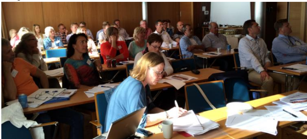
Bilde: Interessert publikum når foredragene ble gjennomført på Kielbåten.