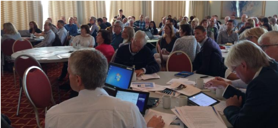
Bilde: Stort interesse blandt deltakerne!