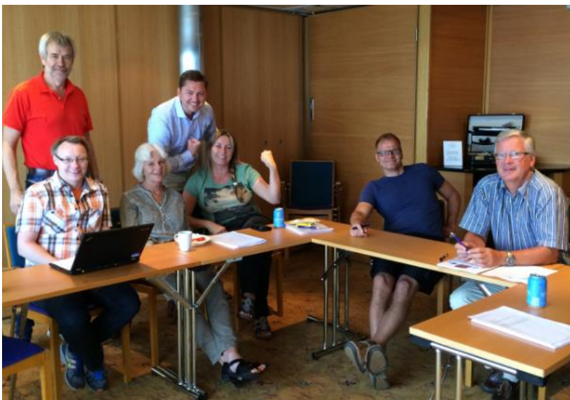
Bilde: Gruppearbeid Kielbåten.