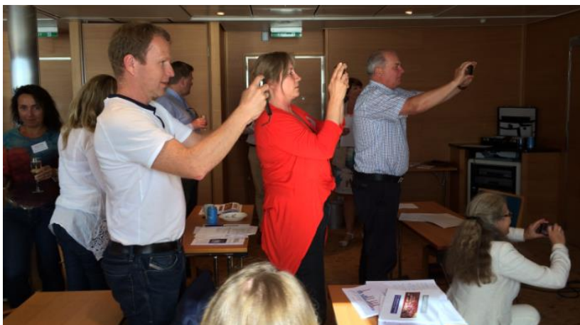
Bilde: Stort interesse for resultatet av gruppearbeidene på Kielbåten.