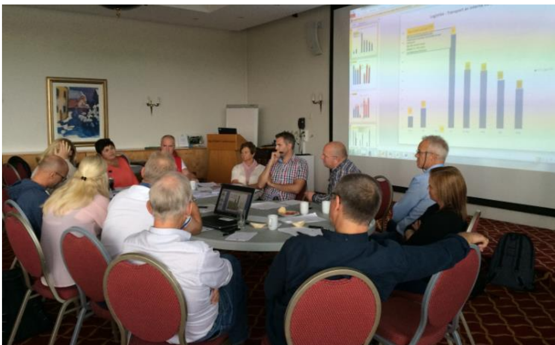
Benchlearning faggruppe Transport/logistikk, fra nøkkeltall (ytelse) til beste praksis, hva kan vi lære av hverandre?