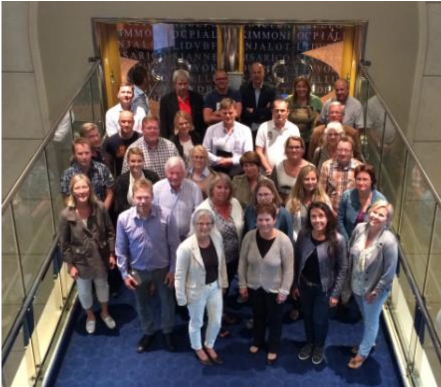
Bilde: NfNs Nøkkeltallsmøte 2014 på «Color Fantasy»

NfN har sammenstilt, analysert og drøftet sine nøkkeltall hvert år siden 1993. Rapporten er konfidensiell og kun tilgjengelig for deltakende virksomheter. Rapporten er underlag for benchlearning for å utvikle beste praksis hos deltakerne. Rapporten inneholder enhetskostnader for de fleste områdene innen FM til et antall kvalitative faktorer som FM strategi, utforming av arbeidsplassene, resultat bruker- og kundetilfredshet, kvalitet bygningsmassen, status miljømerking/arbeid, driftstider mm. Rapporten for næring er tilpasset både eiendomsbesittere og leietakere (inklusive barehouse), men rapporten for sykehus er tilpasset sykehus. Rapporten tar hensyn til både ytelser som utføres i egen regi og som er outsourced.