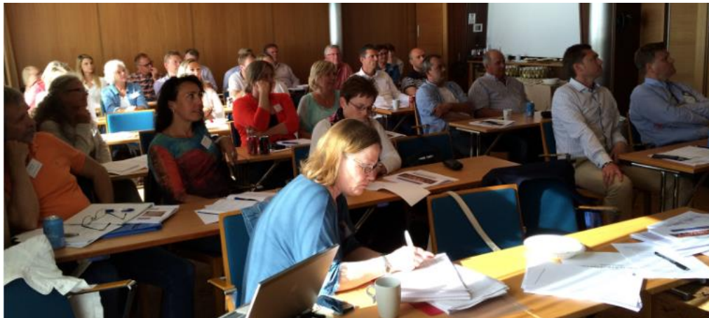
Interessert publikum når foredragene ble gjennomført på Kielbåten.