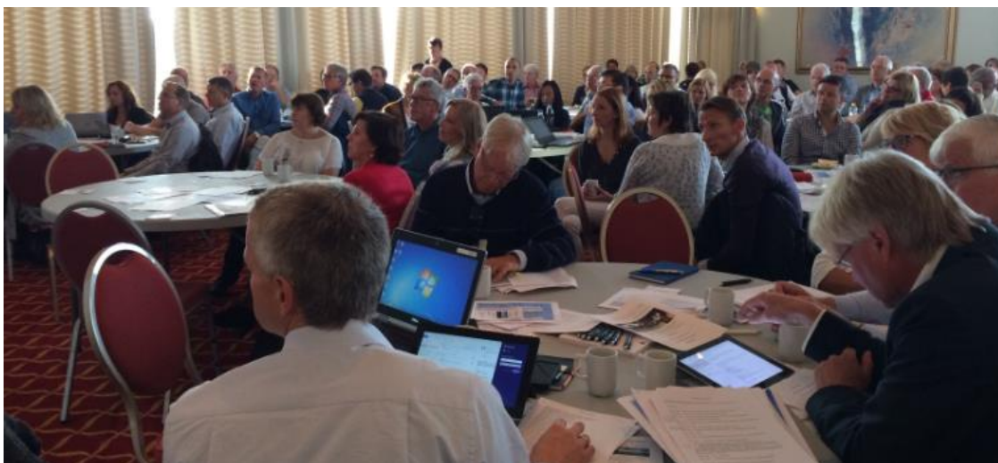
Stor interesse blant deltakerne!